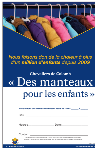
Affiche promotionnelle – Verticale (article n° 10586-F)