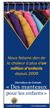
Dépliant « Des manteaux pour les enfants » (article n° 10503-F)