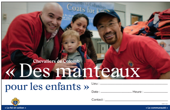
Affiche promotionnelle – Horizontale (article n° 10587-F)

Le Conseil suprême offre les articles ci-dessous à commander par l'intermédiaire de Fournitures en ligne, le portail de commande de fournitures offert sur Officiers en ligne.