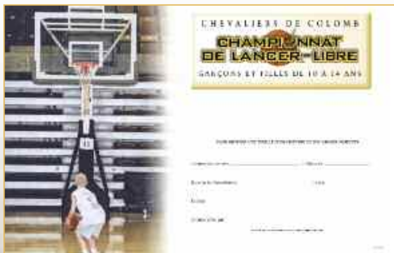
Affiche « Prêt sur la ligne » (N° 1686)