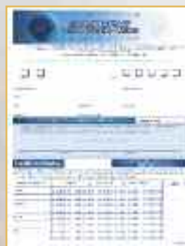
Formulaire de Participation/Feuille de Marquage pour le Championnat de Lancer Libre (N° 1598)