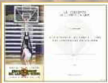
Certificat de Participation (N° 1597)