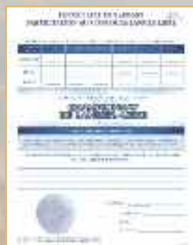
Formulaire de Rapport de Participation au Championnat de Lancer Libre (N° FT-1)