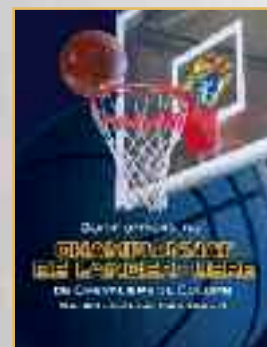
Guide pour le Programme de Lancer Libre (N° 1928)