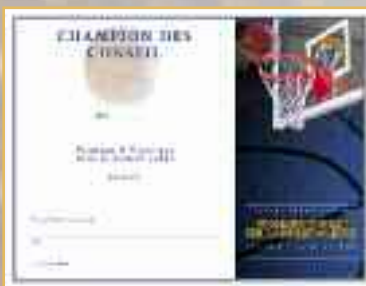
Certificat de Champion de Conseil (N° 1809)