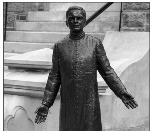
Depuis sa béatification en 2020, une statue du Père McGivney se dresse devant l'église Sainte-Marie de New Haven, où il a fondé les Chevaliers de Colomb.